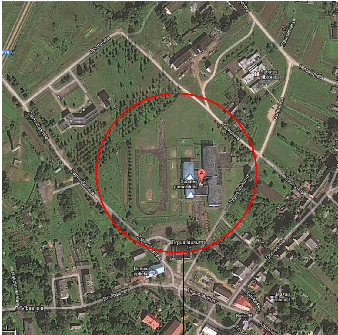
Skolas novietne satelītuzņemumā