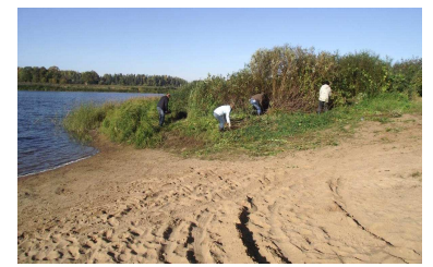
Talka upes krastā pie Dubnas ietekas Daugavā ( http://www.livani.lv )

Ieguvumi no upju kopšanas ir: laivošanas maršruti, mazās uzņēmējdarbības attīstība (laivu nomas, viesu mājas), labvēlīgāki apstākļi zivju resursiem, tiek sakopta ainava un upju pašattīrīšanās veicināšana.