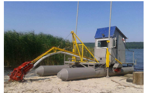
Mazizmēra sapropela ieguves iekārta Sumi, Ukrainā ( http://sumy.all.biz/en/extraction-of-sapropel-s361863#show0 )