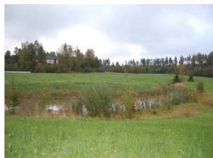
Mākslīgā mitrāja piemērs Somijā (Grinberga L., Jansons V. 2012)

Saldūdens hidroekosistēmu bioloģiskās daudzveidības un funkciju saglabāšanas nolūkā svarīga ir upju un ezeru regulāra apsaimniekošana un kopšana. Upju atjaunošanai Latvijā tiek izmantoti vairāki tehniskie risinājumi, kas īpaši piemēroti mazo un vidēji lielo upju kopšanai: ūdensaugu izplaušana, ūdenstilpju un ūdensteču attīrīšana no mehāniskā piesārņojuma, krastmalu veģetācijas zonas izveidošana, gultnes pārveidošana un uzlabošana.