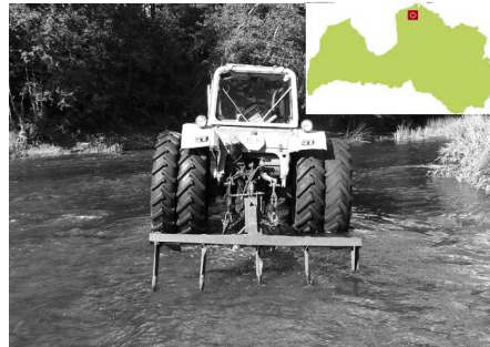
Gultnes irdināšanas un ūdensaugu sakņu sistēmas rāvēšanas darbi Salacas upē (Urtāns, 2008)