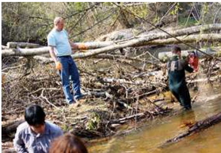
Upes gultnes tīrīšana ( http://www.videsvestis.lv/content.asp?ID=138&what=28 )

Attīstoties baseinu teritorijai kopumā, atsevišķi ir jāplāno arī atsevišķu teritoriju attīstība sociālā, ekonomiskā, kultūras, dabas, rekreācijas un citos aspektos. Daugavas un Veļikajas sateces baseini ir Latvijā, Krievijā un Baltkrievijā esoša sateces baseina daļa, no kuras ūdeņi tiek nesti Baltijas jūras virzienā. Projekta ietvaros teritorijas daļa Krievijā ir Sebežas, Pitalovas un Pleskavas rajons un Pečoru pilsēta, savukārt, Latvijā – Riebiņu, Dagdas, Preiļu, Ilūkstes, Līvānu un Daugavpils novadi.