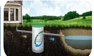
Piemērs individuālajām notekūdeņu attīrīšanas iekārtām privātmājās (SIA „August Latvia”, bez dat.)

Latvijas un Krievijas pierobežas zonās boreālajos klimatiskajos apstākļos viena no nozīmīgām problēmām ir ezeru saldūdens kvalitātes pasliktināšanas process un ātra ūdenstilpju aizaugšana, ko izraisa organisko vielu akumulācija ezerdabes pamatnē (sapropela veidošanās). Uzkrāšanās rezultātā ezeru dziļums samazinās un tie sāk aizaugt. Viena no ezeru reaktivācijas metodēm ir sapropela ekstrakcija ar sūcējiem, ezers tiek padziļināts, tiek palielināts skābekļa daudzums, kas izšķīdīs ūdenī.